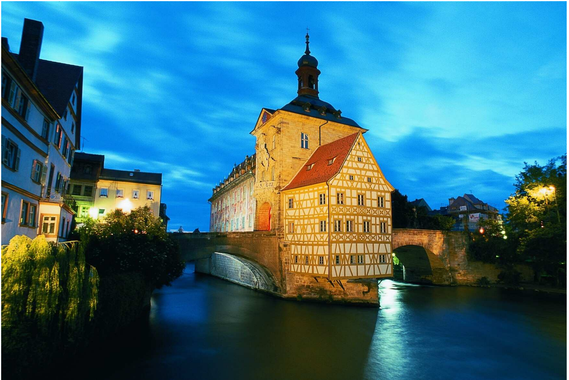
Bamberg: Old Town Hall