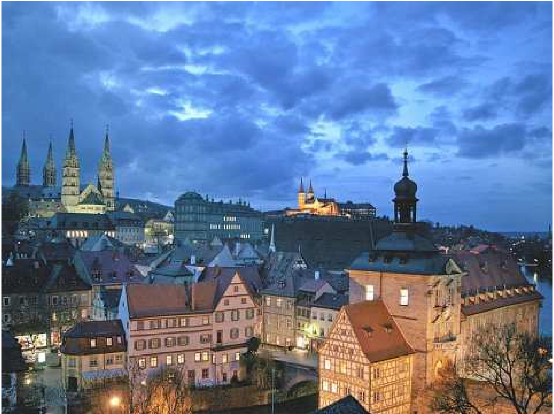
Bamberg: Old Town Panorama